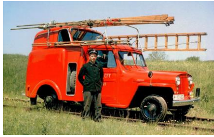
SBB P 77903