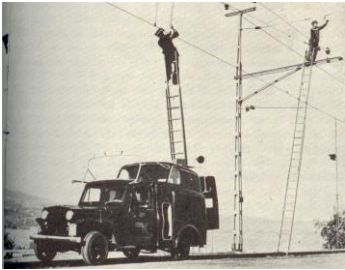
SBB CFF P 7025