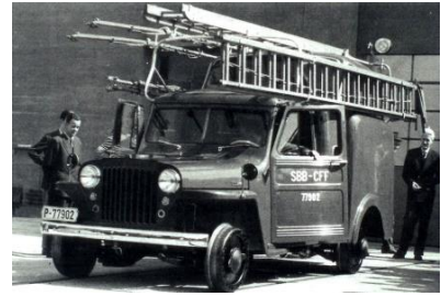
SBB P 77902

SBB P 77902 und SBB P 92981 Willys Overland , mit Aufbau für Fahrleitungsunterhalt. * Beide Fahrzeuge konnten durch Tauschen der Räder sowohl auf der Strasse- und Schiene fahren. Mit einem Spezial 2 Achs Anhänger konnte der Rollleiterwagen auf der Strasse zum Einsatz transportiert werden. FRIHO Spezialmodell in gemischt Bauweise mit 2 Achs Antrieb oder als Standmodell. Nur für 2L = DC erhältlich.