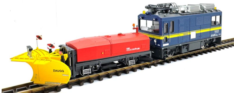
Foto: Serien Lokmodell, noch nicht komplett

In der 1. Auflage erscheinen im 1. Quartal 2026 insgesamt 50 Stk. MOB HGem 2/2 2501 rot (ohne Zahnrad Antrieb, Dachaufbau angepasst) sowie MOB Gem 2/2 2502 – 2504 blau /gelb.